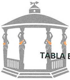
TABLA ESTADÍSTICA DE LA TERCERA SESIÓN DEL PRESENTE AÑO DE LA COMISIÓN EDILICIA DE TRÁNSITO Y VIALIDAD